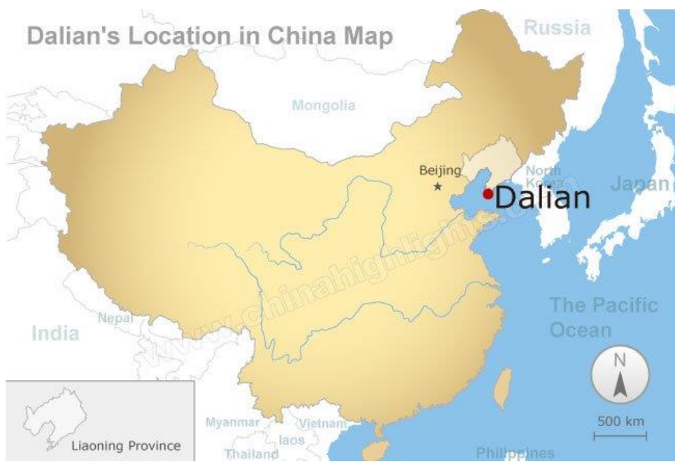
Dalian's Location in China Map