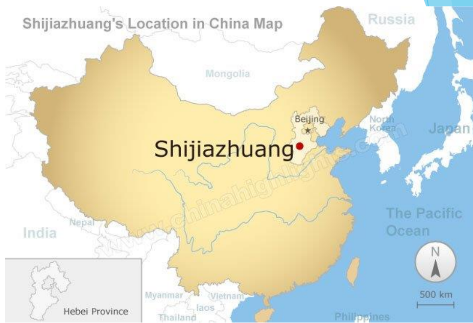
Shijiazhuang's Location in China Map